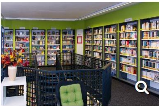
Bücherei St. Joseph - Obergeschoss