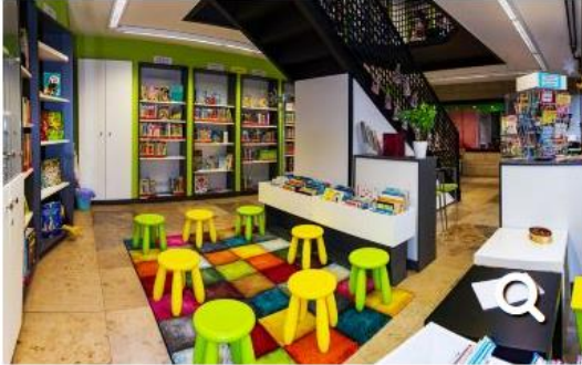
Bücherei St. Joseph - Erdgeschoss