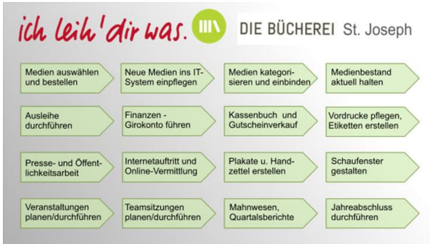
Abb. 1: Die wichtigsten Arbeitsschwerpunkte in einer Bücherei